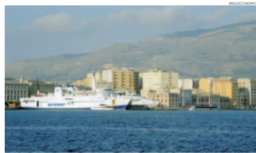
Sviluppo. Una delle strategie di Trapani è quella di puntare sul mare: oltre alle gare sportive sul modello della Vuitton Cup si vuole rafforzare il turismo crocieristico

Territorio. Il piano strategico elaborato dall'ente camerale